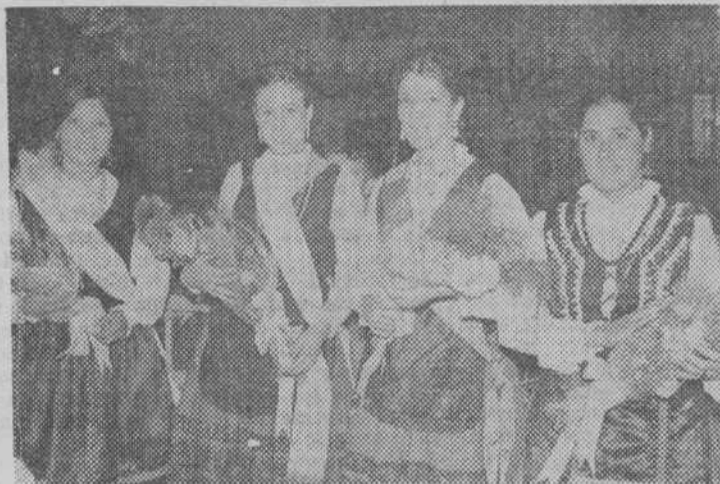
He aquí dos placas obtenidas en Covarrubias. A la izquierda, la "Reina" con el alcalde y a la derecha, la corte de honor.