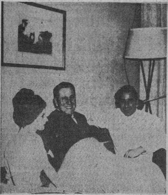
El ex-presidente argentino, Juan Domingo Perón, se encuentra bastante restablecido de la operación que sufrió hace unos días en una clínica de Madrid. En la foto le vemos en su habitación del sanatorio con su esposa Isabel y un enfermero.