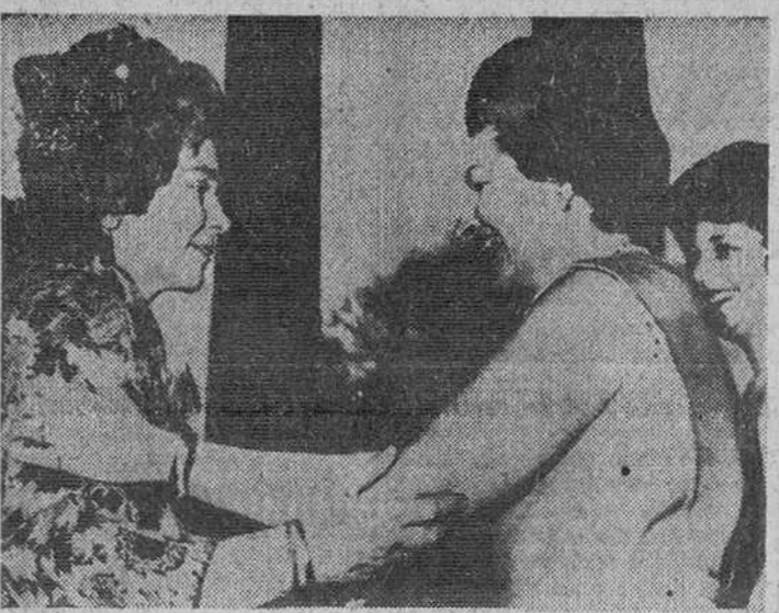
Campechanamente, la primera dama de los Estados Unidos, Lady Bird Johnson, saluda a la Reina Federica de Grecia, en el pórtico Norte de la Casa Blanca, donde la Soberana asistió a un banquete en su honor. A la derecha, Linda Johnson, hija del presidente. La Soberana griega se encuentra realizando una visita no oficial a los Estados Unidos.