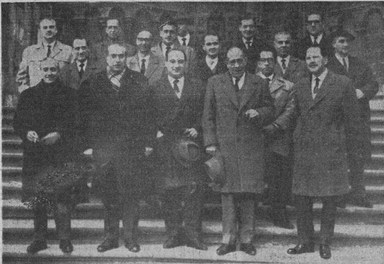
Como primer acto corporativo del nuevo Ayuntamiento, el alcalde y concejales asistieron ayer, en la Catedral, a una misa de Espíritu Santo, oficiada por el vicario general del Arzobispado y deán del Cabildo, Ilmo. Monsiñor D. Buenaventura Díez y Díez, que dirigió, además, elocuente plática. A la salida del piadoso acto, "Fede" captó la precedente placa de los concurrentes a la ceremonia