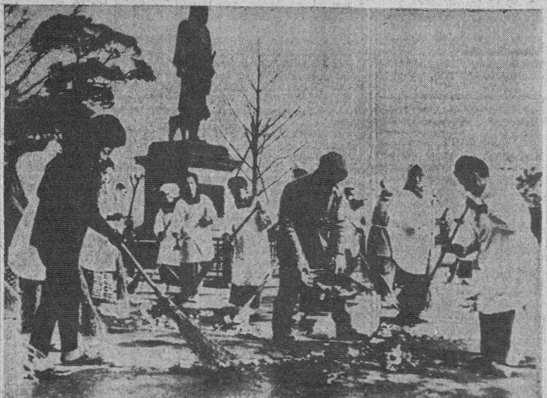
Nada menos que un millón de voluntarios se han presentado en Tokio para participar en la llamada "Operación Limpieza" de Tokio. En la fotografía vemos algunos voluntarios trabajando en el narue Ueno de la capital japonesa.