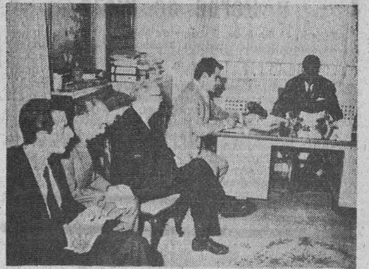
El expresidente de la República de Katanga ha celebrado en Madrid una conferencia de Prensa en la que Moisés Tshombe ha explicado diversos problemas relativos a la situación en aquella zona del Congo. En la fotografía vemos al expresidente Moisés Tshombe en un momento del acto.