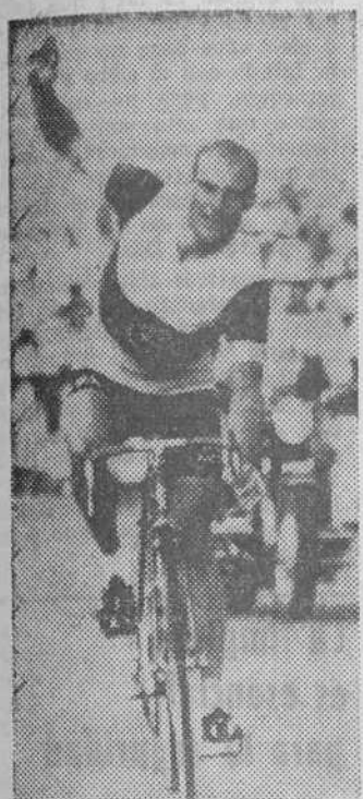
Nuerburgring. — El alemán Rudi Altig, nuevo campeón del mundo de ciclismo, en el momento de llegar triunfador a la meta.

También Miguel Mas, actual campeón mundial en medio fondo, tuvo una mala actuación