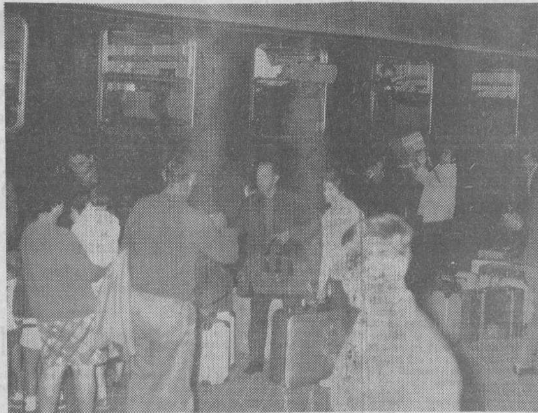
Madrid. — A las cinco de la mañana del sábado, llegó un tren especial de Irún, con emigrantes españoles que vienen a pasar sus vacaciones a España. En la foto, un momento de la llegada de esta gente que cargada de ilusiones viene de nuevo a disfrutar el clima de España.