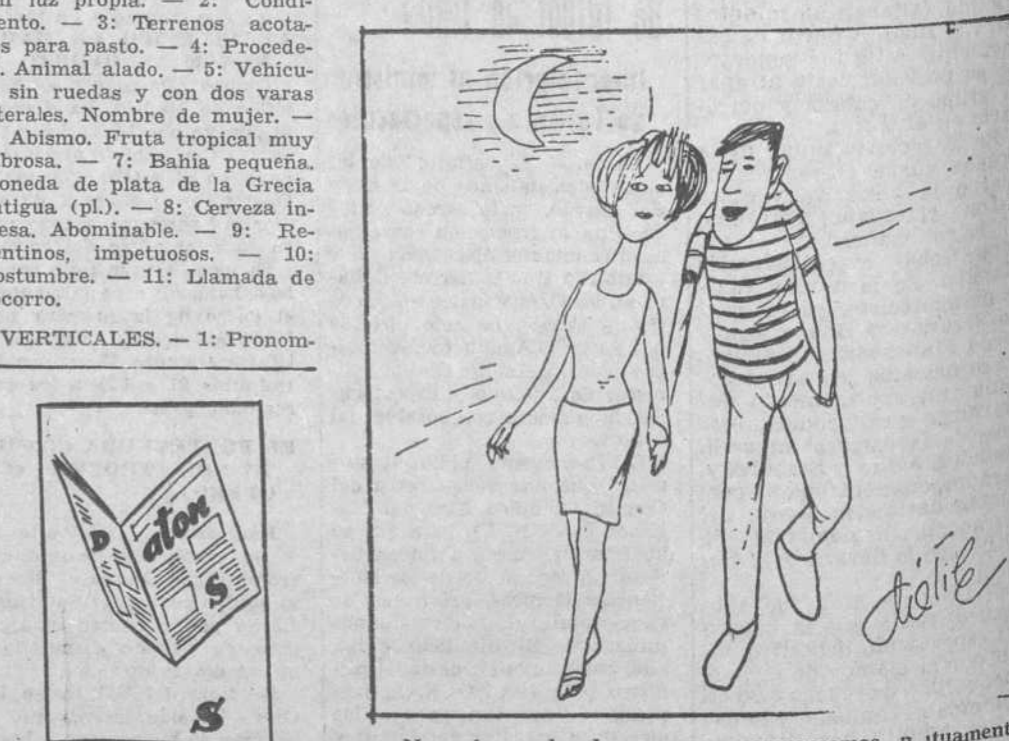
—No cabe duda de que nos compensamos mutuamente y estamos hechos el uno para el otro. Incluso a mí me han sustituido en todas y a ti te han aprobado.

SOLUCIONES AL CRUCIGRAMA: HORIZONTALES. — 1: R. —