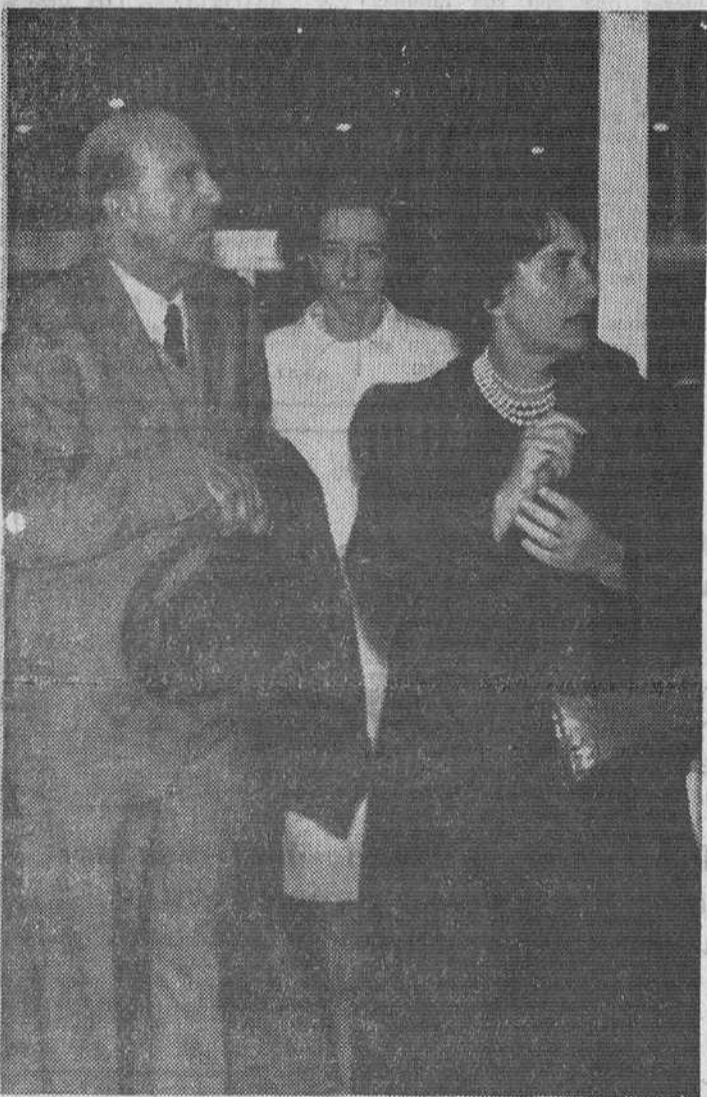
Ha vuelto por España, una vez más, el ex rey de Italia, Humberto de Saboya. Aquí le vemos a su llegada al aeropuerto transoceánico de Barajas, donde fue recibido por varias amistades.