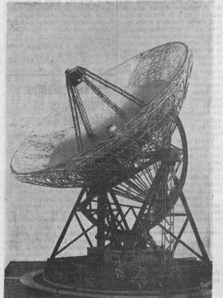
Bonn. — (Impresiones de Alemania). — El radiotelescopio móvil más grande del Mundo será erigido próximamente cerca de la capital alemana, Bonn. Nuestra foto muestra una maqueta construida según los planes del Instituto Astronómico, de la Universidad de Bonn. La enorme oreja espacial se montará para captar las señales electroacústicas de las estrellas, las cuales, a causa de su gran distancia, no pueden ser recibidas ni con los telescopios más grandes. El gigantesco aparato, móvil en todas las direcciones, dispone de una antena de espejo cóncavo, con un diámetro de 90 metros o más. Con la antena en su posición más alta la instalación tendrá una altura de 120 metros. Sólo los elementos móviles del radiotelescopio tendrán un peso de 1.500 toneladas. Por medio de la nueva instalación, los investigadores alemanes esperan obtener nuevos resultados científicos respecto a la composición y el origen del universo.