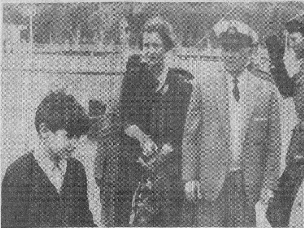
Málaga. — Su Excelencia el Jefe del Estado ha recorrido hoy diversas instalaciones de la Costa del Sol, acompañado de su esposa y del ministro de Marina y señora. Posteriormente, en el campo de golf, en la urbanización de Sotogrande del Campo de Gibraltar, practicó este deporte. De regreso a Marbella, pasó el resto del día en compañía de sus familiares.