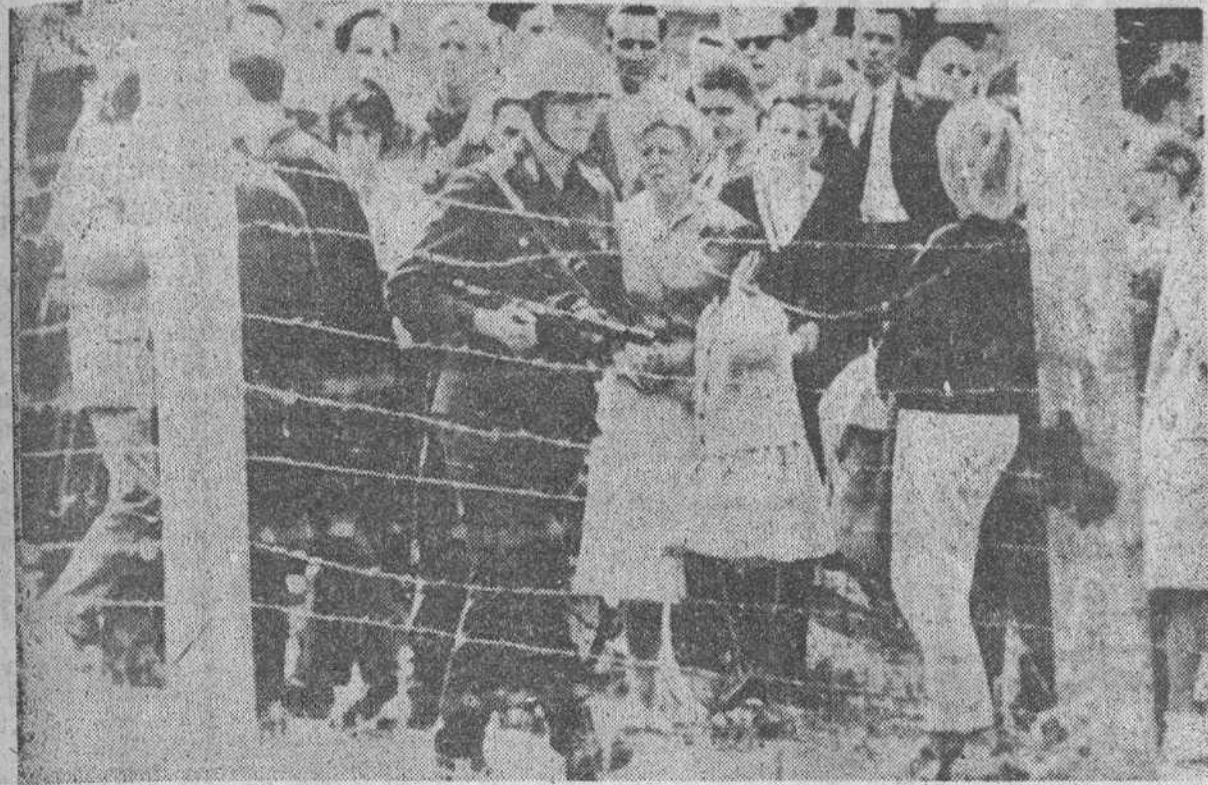
Berlin. — En la noche del sábado al domingo, el Gobierno de la Alemania oriental ha cortado todos los accesos desde su territorio al Berlín-Oeste para impedir la constante huida de personas, que fíjamente sobrepasan la cifra de 3.000 diarias. Junto a las alambradas levantadas por los comunistas, un soldado rojo presta servicio de vigilancia del lado occidental, mientras numerosos berlineses occidentales contemplan con pesar esa otra parte de su ciudad sometida hoy más que nunca al terror rojo.