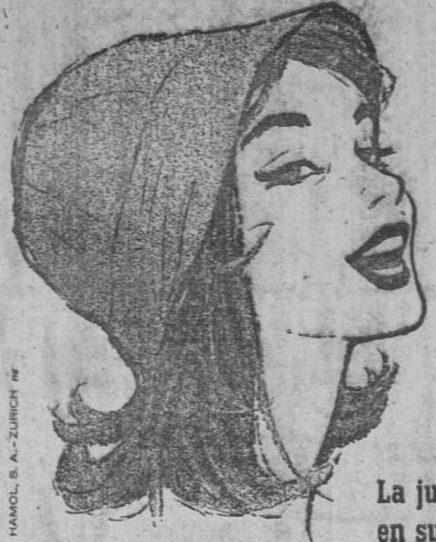
La juventud en sus labios