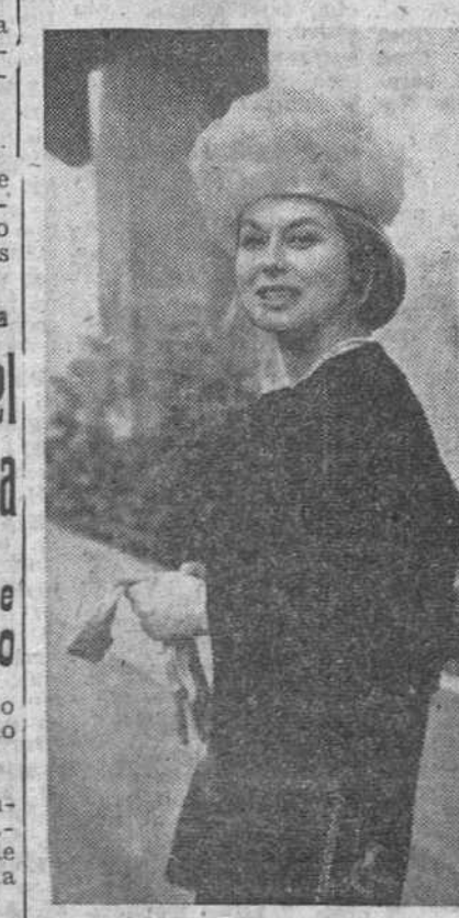
Madrid. — Ha llegado a Madrid la joven y bellísima estrella alemana Marianne Hold, feliz intérprete de "Lili Marleen", que interpretará en España la película "Caribio mio", junto al actor español Vicente Parra.