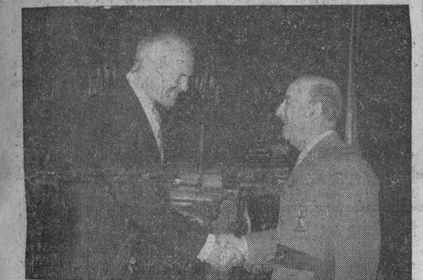
Despedida de Mr. Lodge Madrid. — El hasta ahora embajador de los Estados Unidos en Madrid, Mr. Lodge, se despide de S. E. el Jefe del Estado al dar por terminada su misión diplomática en España y regresar a su país.

Presenta sus credenciales al Caudillo el nuevo embojador de Dinamarca