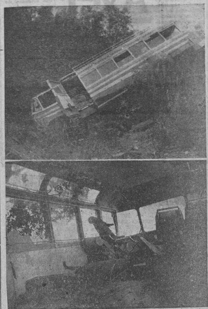
Tarrasa. — Un autocar que procedía de Navareles ocupado por 36 excursionistas que habían aprovechado los días festivos para efectuar excursiones, se precipitó el último día, al regreso, por un barranco de más de cuarenta metros. El hecho ocurrió a las ocho y media de la noche, resultando siete muertos y 29 heridos, tres de ellos en estado gravísimo. La mayoría de los excursionistas eran de Barcelona.

Cabo Cañaveral (Florida). — El proyectil-cohete «Redstone», que trasladará al primer astronauta en la primera aeronave norteamericana tripulada por un ser humano, probablemente no más tarde de cinco semanas, ha sido colocado en su plataforma de lanzamiento. Sin embargo, no ha sido fijada la fecha para el lanzamiento de pruebas, como tampoco la fecha en que se procederá al lanzamiento al espacio del proyectil con el ser humano a bordo. Es probable que si las pruebas dan el resultado apetecido, se intente el vuelo tripulado a comienzos de Mayo.—Efe.