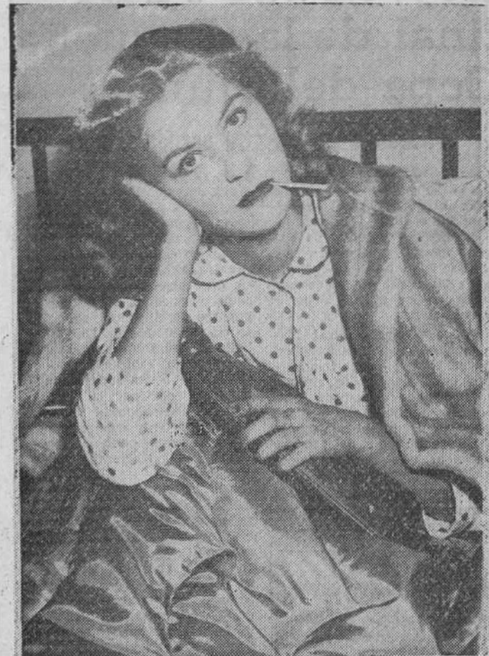
La rubita está triste. ¿Qué tendrá la rubita? Hasta qué punto le duele algo podría decirnoslo el recién descubierto «dolorímetro», puesto a punto por tres investigadores canadienses...