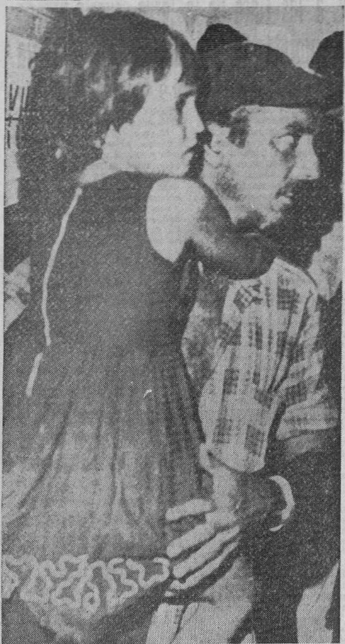
Diecinueve de los 29 hombres, mujeres y niños, familias de pescadores y obreros que huyeron de Cuba...