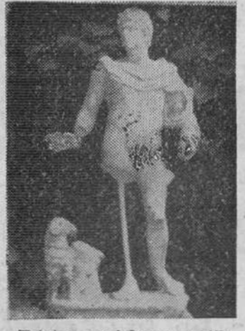
Estatua parcialmente mutilada de Hermes, encontrada por un labriego malagueño cuando araba su tierra.