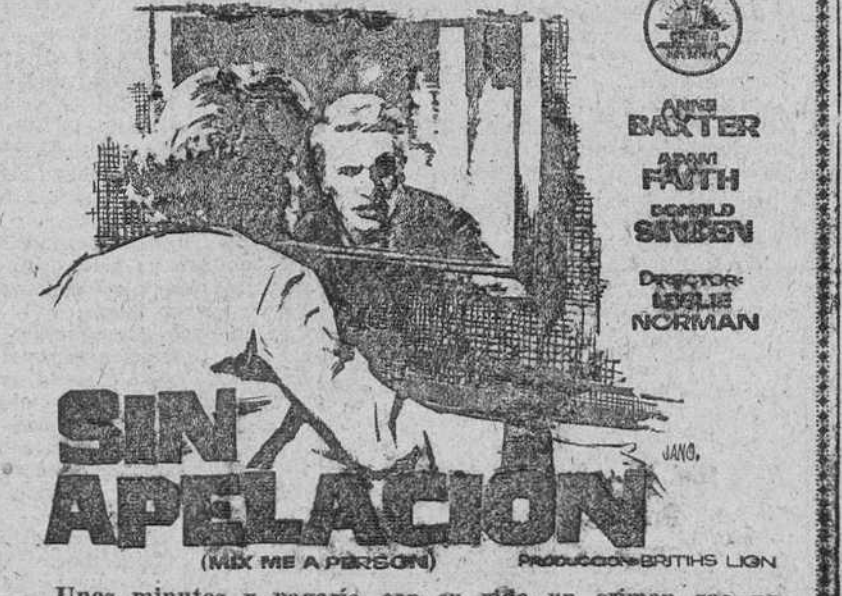
SIN APTELACION (MAX ME A PERSON) PRODUCCION BRITIS LION

Unos minutos y pagará con su vida un crimen que no había cometido. ¡El «suspense» al máximo!