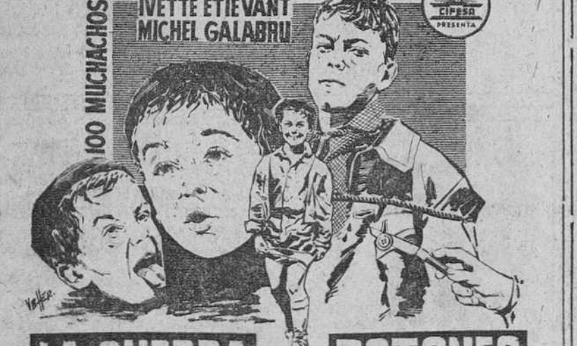
LA GUERRA DE LOS BOTONES (LA GUERRE DES BOUTONS)

¿Ustedes han pensado en lo que haría un ejército en el que a todos los hombres se les quitasen los botones del vestuario...?