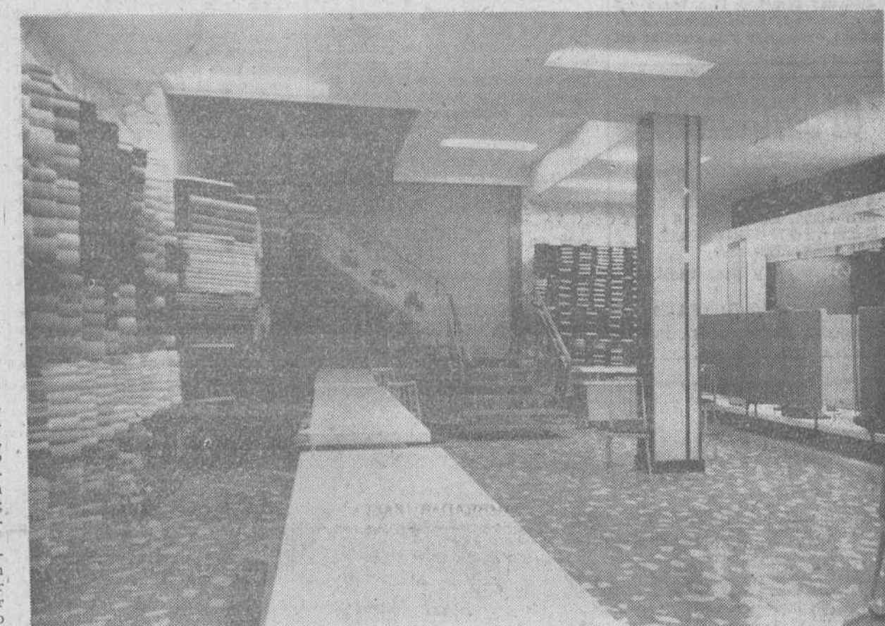
La amplitud y buena disposición de la planta baja queda patente en la precedente placa. También refleja la sencillez en la decoración logrando un conjunto armonioso y en el que destacan la riqueza de los materiales empleados y el acierto en la disposición de los diversos elementos que la componen. Al fondo, la soberbia y airosa escalera que da acceso a las plantas superiores. Esta planta baja está especialmente dedicada a: lencería, sedería, etc., es decir, tejidos en general.

La magnitud de los escaparates, modernos y bien concebidos, queda realzada por el alarde de luz, verdadero derroche diríamos, consiguiendo un efecto extraordinario que llama poderosamente la atención.