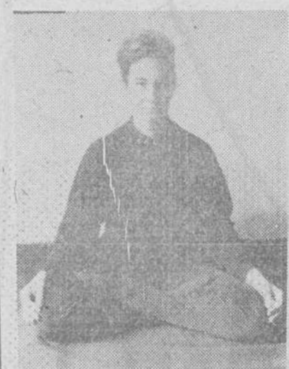
Una de las posturas del "Hatha"

El "hatha" es la rama física del Yoga, la filosofía-religión hindú, que abarca todas las actividades de la vida. A nosotros no nos interesa el Yoga, pero sí vamos a ocuparnos un poco de "hatha" para al menos no ignorar la gimnasia de moda. TRES PARTES El "hatha" se puede dividir en tres partes: las posturas, la respiración y los movimientos en general del "yogui". Sin duda lo más importante es la respiración. Cuando se respira bien, se pueden controlar el estado de ánimo, de depresión o de cualquier momento de nerviosismo. Sabiendo respirar, se puede concentrar la persona fácilmente en el estudio y se discurre con más facilidad. La cosa es como para pensarla despacio. ¿No es cierto? Pero en este sentido, podemos hacer muy poco desde aquí. Sería necesario acudir a unas clases de las que hay muy pocas en España.