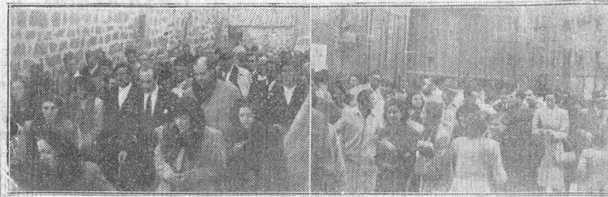
EL GOBERNADOR CIVIL DE LA PROVINCIA PENETRANDO EN EL PUEBLO DE VILLAMIEL DE LA SIERRA, PARA INAUGURAR EL SUMINISTRO DE ENERGIA ELECTRICA. — A LA DERECHA EL PUBLICO SALIENDO AYER, POR LA MAÑANA, DE LA IGLESIA DE SAN LESMES, DESPUES DE LA CEREMONIA RELIGIOSA CELEBRADA EN SUFRAGIO DE LAS ALMAS DE LOS CAIDOS POR DICHS Y POR ESPAÑA.