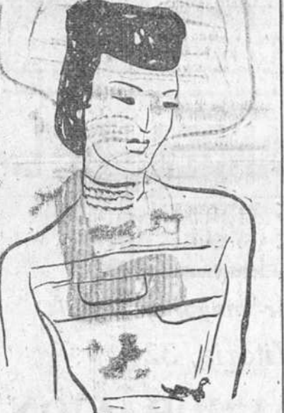
Traje "sweater", con tres bolsillos escudados. Toca de terciopelo negro. (Creación Robert Figueat).

que nos espera con los brazos abiertos, uniforme de parisiense que requiere un cutis translucido, y una perfecta distinción de color en nuestro maquillaje. Por otra parte, los primeros días nublados ya nos robaron el oro acumulado en nuestra epidermis por los baños de sol y, así resulta que ya no queda bonito, sino de un matiz sucio que nos es necesario abandonar lo más pronto posible si queremos lucir los tonos a la moda, que precisamente, a fuerza de ser neutros, no favorecen nada, o por lo menos, no tanto como los matices alegres que hemos usado este verano.