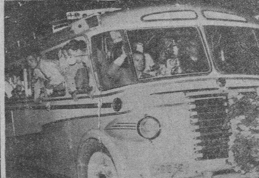
TRIUNFAL RECIBIMIENTO DEL «BARCELONA F. C.»

Barcelona. El autocar con los jugadores del equipo catalán, asomados a las ventanillas, corresponden a las declaraciones de los millares de aficionados que acudieron a recibirlos a su llegada procedentes de París, después de conquistar la Copa Latina.