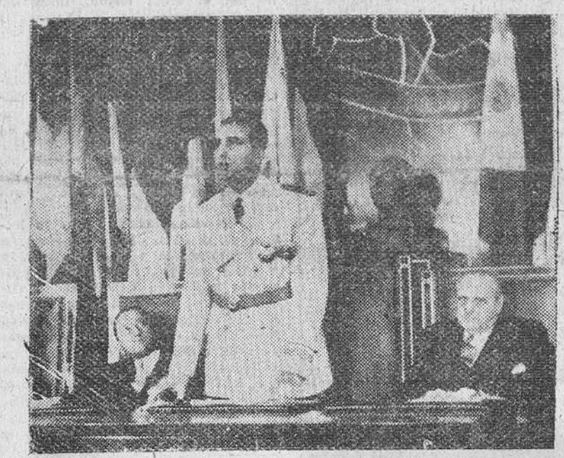
Madrid.—El ministro de Educación Nacional, Sr. Ruiz Jiménez, pronunciando el discurso de clausura del I Congreso Iberoamericano-Filipino de Archivos, Bibliotecas y Propiedad Intelectual. Le acompañan en la mesa presidencial, el presidente de las Cortes Españolas don Esteban Bilbao y el embajador extrarrepresentativo de Colombia