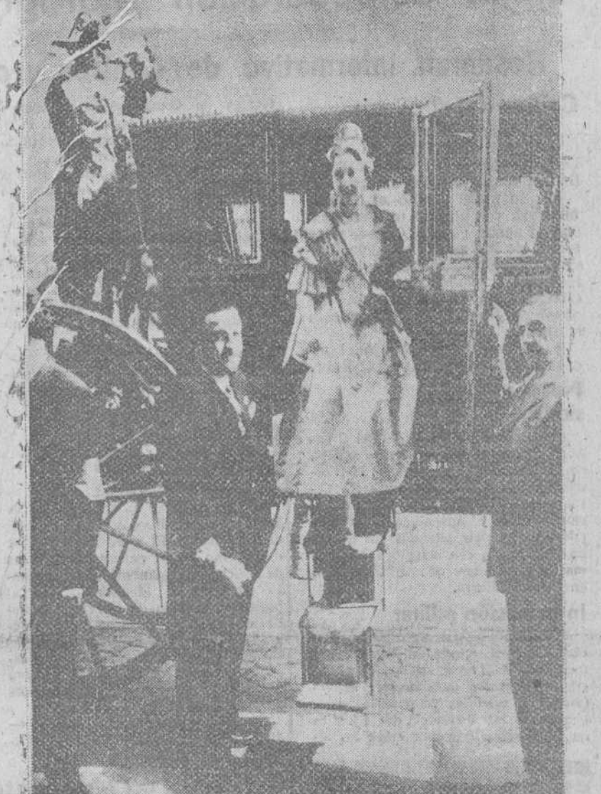
Valencia.— La fallera a la llegada al Ayuntamiento desciende de la carroza, ayudada por el presidente de la Junta Central Fallera, para saludar al pueblo desde el balcón central.