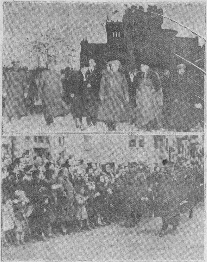
Javier (Navarra).—En la fotografía superior, Su Excelencia el jefe del Estado, acompañado de su esposa, ministros y autoridades, a su llegada a Javier, en cuyo castillo se celebró el acto de clausura del IV Centenario de la muerte de San Francisco Javier. En la parte inferior, el pueblo de Javier aclama al Caudillo, a su paso por las calles de la villa.