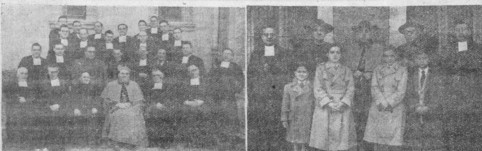
Los Colegios de La Salle y "Liceo Castilla" tributaron ayer sentido y cordial homenaje a los nuevos obispos de Orense y Auxiliar de Calahorra, acompañado por el director, capellán, Hermanos y otros íntimos insignias a los Jóvenes de Acción Católica. En la "foto" de la derecha figura el Doctor del Campo con los Hermanos director y subdirector y los sobrinos del nuevo obispo.