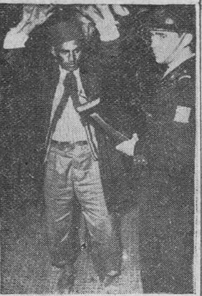
Varios de los manifestantes del Istijal, detenidos por la Policía francesa con motivo de los recientes disturbios ocurridos en Casablanca

Banderas tunecinas y del Marruecos francés ondeaban en los