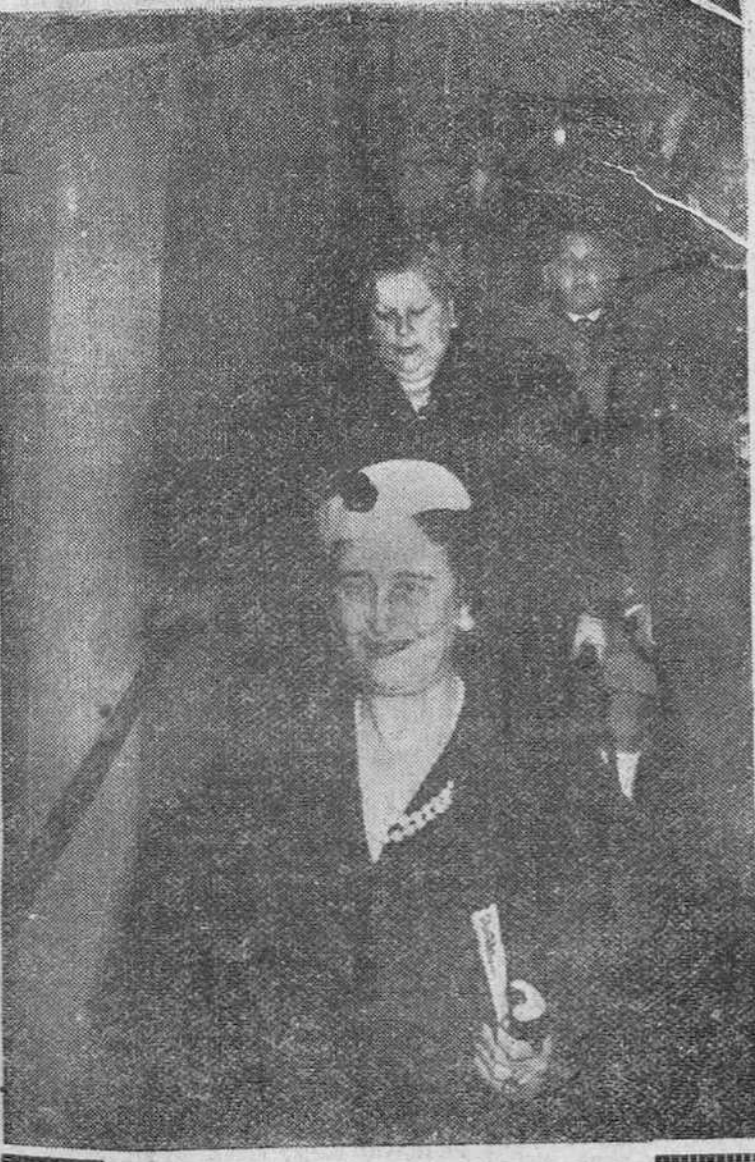
Madrid. — La Excmo. Sra. D.ª Carmen Polo de Franco, esposa de S. E. el Jefe del Estado, abandona el Teatro Calderón, después de presidir la función benéfica celebrada bajo su patrocinio, el pasado domingo, en favor de los humildes madrileños y en la que se recaudaron más de cien mil pesetas.

Nueva York. — En una conferencia de dos horas de duración, el presidente electo, Eisenhower, y el general Mac Arthur, han tratado hoy de los problemas referentes a la paz en Corea y en el Mundo, en general. —Efe. DECLARACIONES DE MAC ARTHUR Nueva York. — Después de su entrevista con el presidente electo, Eisenhower, el general Mac Arthur manifestó a los periodistas: "He tenido un entrevista con un viejo amigo y camarada, al que no había visto desde muchos años. Ha sido la reanudación de nuestra vieja amistad y camaradería. Hemos tratado de los problemas de la paz en Corea y en el Mundo en general, y lo mismo que él, yo en lo que me rendiré frutos." A la reunión asistió también el secretario de Estado, John Foster Dulles. —Efe.