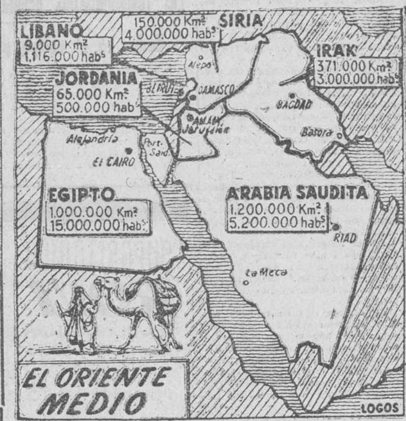
EL ORIENTE MEDIO