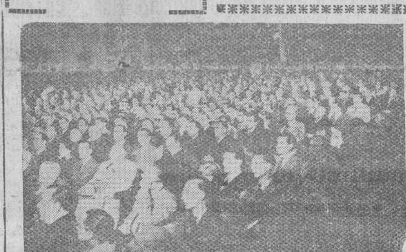
Madrid.—Cinco mil representantes de empresarios, técnicos y obreros, llegados de toda España, asisten en Madrid al acto de proclamación de candidatos a procuradores sindicales en Cortes