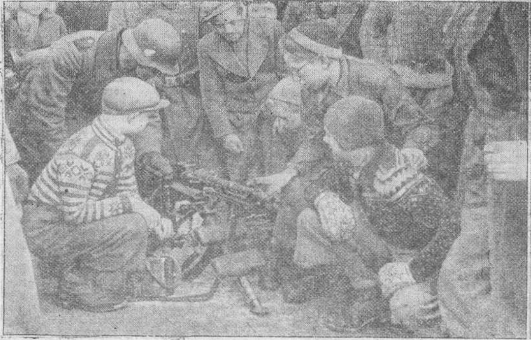
LOS NIÑOS Y LA GUERRA Los niños se interesan por todo. Estos muchachos abusan de la paciencia de unos soldados alemanes para abrumarles con preguntas sobre el manejo de una pequeña antiparradora.

Estos zapatos ya son de todos los colores. Su elasticidad y resistencia hacen suponer que esta nueva moda, aunque antigua, tendrá favorable acogida en todos los ámbitos del universo, sin que desterremos por ello para la mañana y deportes los clásicos zapatos de estilo inglés.