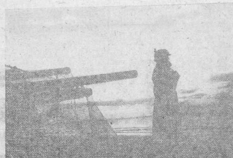
Guardia de Año Nuevo en la Costa Atlántica

Lo que se hace público a los efectos de la recaudación del impuesto citado con efectos para Hoteles, Pensiones, Restaurantes, etcétera.