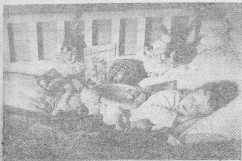
El sueño del niño en vísperas de Reyes