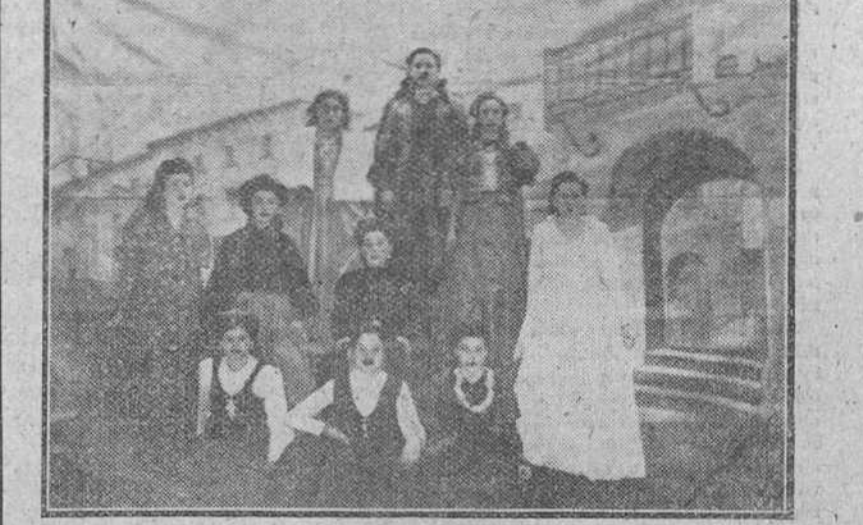
Arriba, el grupo de estudiantes de Acción Católica del Instituto y Escuela del Magisterio, durante la interpretación, brillantísima, del auto sacramental "El veneno y la triaca", en la velada celebrada el domingo con motivo de la fiesta de Santo Tomás de Aquino. Abajo, el Cuadro dramático de las juventudes de Acción Católica de San Gil durante su actuación en el salón-teatro del Círculo Católico de Obreros.