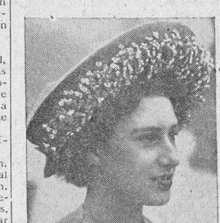
La Princesa Margarita de Inglaterra.

PERO EN EL PALACIO DE BUCKINGHAM SE DESMIENTE LA NOTICIA YANKI DICE QUE LA PRINCESA MARGARITA DE INGLATERRA VA A VISITAR ESTADOS UNIDOS Londres.—En el Palacio de Buckingham se desmienten los rumores de que la princesa Margarita pasará las vacaciones del año próximo en los Estados Unidos. En la Oficina de Prensa de Palacio, se dice que esa información carece totalmente de fundamento y es completamente falsa. La noticia ha sido dada en el vespertino "Star" y decía que la princesa Margarita tal vez visitara los Estados Unidos en 1949. "Los amigos de la princesa Margarita —dice el periódico "Star"— no se sorprendrían si aquella hiciera un viaje por su propia cuenta el año próximo. Se sabe que la gustaría visitar los Estados Unidos y muchos de sus amigos norteamericanos, que se encuentran en Londres, entre los que figura la señorita Douglas, hija del embajador, estarían encantadas de atenderla allí durante su estancia".—Efe.