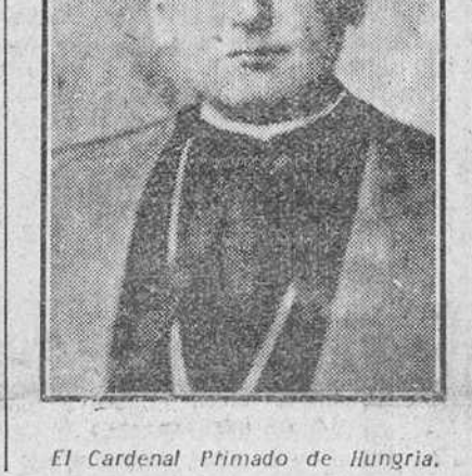
El Cardenal Primado de Hungría.

LA O. N. U. DISCUTE DE NUEVO EL PROBLEMA DE PALESTINA Estudia las denuncias de Egipto sobre violación de la tregua por los judíos Paris.—El Consejo de Seguridad se ha reunido a las 10,50 para estudiar las violaciones cometidas por los judíos en la tregua de Palestina, dando prioridad a este asunto y dejando para más tarde el caso de Indonesia, que quedó sin terminar en la reunión de anoche.—Efe. TENDRAN QUE EVACUAR LOS EGIPCIOS EL NEGEV Tej-Aviv.—Los observadores de las Naciones Unidas dicen que si los judíos consiguen llegar al mar, al Sur de Gaza, esta operación podría obligar a las fuerzas egipcias a evacuar toda la región del Negev.—Efe. ENSAJES DEL YEMEN El Cairo.—Una misión especial del Yemen ha visitado al Rey Faruk, el que ha entregado un mensaje del gobernador del Yemen. Imán. La misión continuará hacia Transjordania para entregar otro mensaje al Rey Abdullah.—Efe. BUNCHE HABLA POR RADIO Nueva York.—El mediador provisional