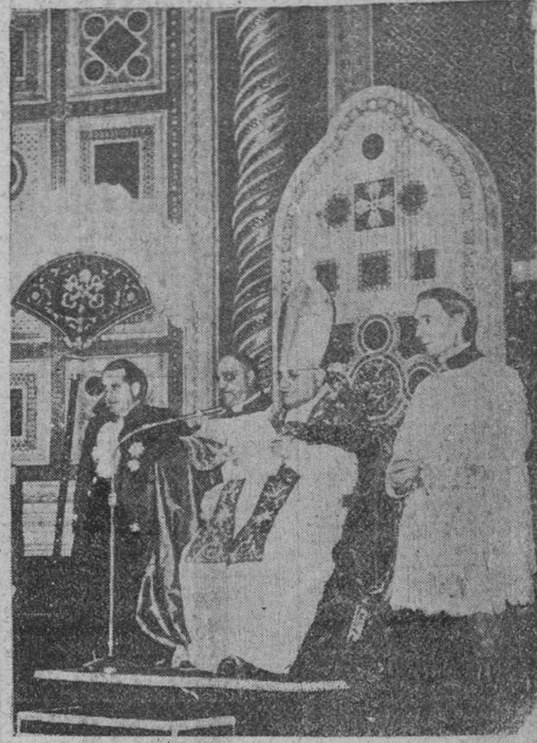
El primer Sínodo Diocesano de Roma. Su Santidad el Papa Juan XXIII dando lectura a su discurso inaugural del Sínodo Diocesano de Roma, durante la solemne ceremonia celebrada en la basílica de San Juan de Letrán.

Dag Hjalmar Agne Carl Hammarskjöld, secretario de las Naciones Unidas y Ralph Bunche, vicesecretario para Asuntos Políticos Especiales, que ayer llegaron a Madrid para una estancia de dos días. Mr. Hammarskjöld se entrevistará con S. E. el Jefe del Estado y otras autoridades españolas.