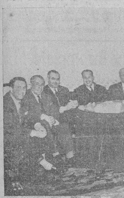
He aquí un grupo de los reunidos en el Hotel Condestable.

Se trataba de dar solución al problema planteado por el pelotari Ogueta en relación con las Empresas Unidas de Mano, cuyos representantes invocaban unos derechos contractuales que, al parecer, no eran respetados por el manista.