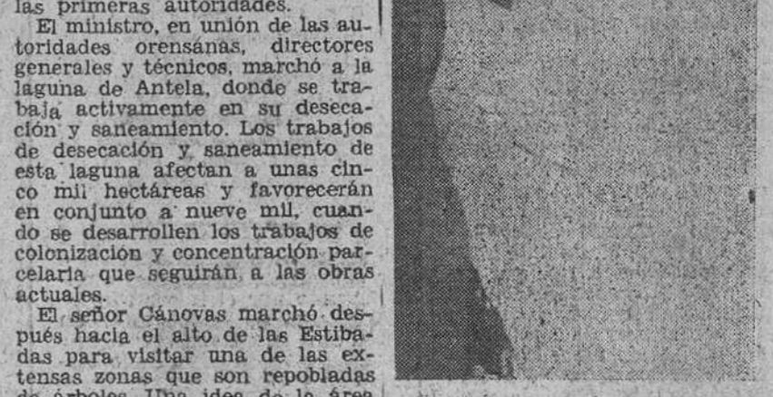
El jugador de fútbol sueco, Simonsson, recientemente fichado por el Real Madrid, ha sido lesionado durante su segundo entrenamiento. Un jugador amateur, con el que jugaba, entró en colisión con él, ocasionándole una lesión en la cadera izquierda. El sueco ha empezado con mal pie... o con demasiados pies.

Orense.— El ministro de Agricultura llegó a esta capital acompañado de los directores generales de Agricultura, Ganadería, Instituto Nacional de Colonización y del Servicio de Concentración Parcelaria. Fue recibido por las primeras autoridades. El ministro, en unión de las autoridades orensanas, directores generales y técnicos, marchó a la laguna de Antela, donde se trabaja activamente en su desecación y saneamiento. Los trabajos de desecación y saneamiento de esta laguna afectan a unas cinco mil hectáreas y favorecerán en conjunto a nueve mil, cuando se desarrollen los trabajos de colonización y concentración parcelaria que seguirán a las obras actuales. El señor Cánovas marchó después hacia el alto de las Estibadas para visitar una de las extensas zonas que son repobladas de árboles. Una idea de la área que en este aspecto se lleva a cabo en la provincia, la da la cifra de 52.000 hectáreas de montes repoblados en poco más de diez años. En el último se repoblaron más de nueve mil y en el presente se espera rebasar esta cifra. A continuación, fueron inspeccionados los trabajos de concentración parcelaria de Tintores y Vilela, que afectan a 443 hectáreas en las que hay actualmente 5.710 parcelas pertenecientes a 757 propiedades. Estos trabajos