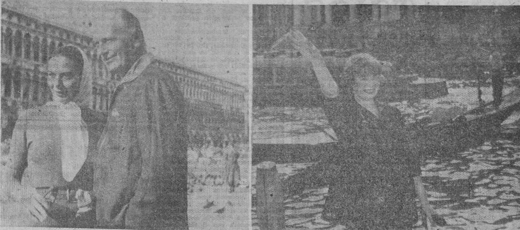
A la izquierda, el actor alemán Gurel Jurgens, pasea en compañía de su mujer por la plaza de San Marcos. A la derecha, Shirley Mac Lane, saluda simpáticamente junto a uno de los canales de Venecia, a donde, como Jurgens, ha acudido para asistir al XIX Festival Internacional Cinematográfico.