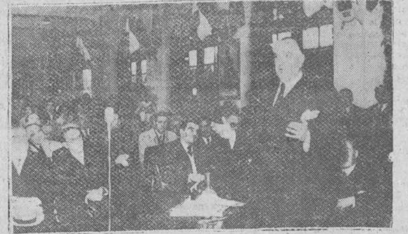
Canfranc.—El ministro de Obras Públicas, Sr. Conde de Vallellano, durante su discurso en la estación internacional, con motivo del centenario de la iniciativa para la construcción del ferrocarril de Canfranc.— (Foto Cifra)

Orense.—En la próxima reunión del Consejo económico sindical de la provincia se tratarán, entre otros temas, de las posibilidades de instalación de un aeropuerto. Dado el desarrollo industrial que promete a la provincia el constante aumento de su producción hidroeléctrica, se siente cada vez con carácter más apremiante la creación de mayores y mejores vías de comunicación.—Cifra.