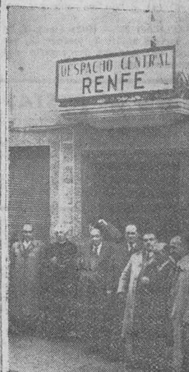
Personalidades asistentes al acto inaugural del despacho central que la RENFE ha instalado en la villa de Pradoluengo, celebrado el pasado lunes