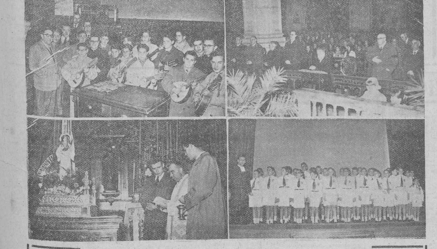
Cuatro planos de los actos celebrados en nuestra ciudad, con motivo de la fiesta de Santa Cecilia. De izquierda a derecha y en los grabados de la parte superior, un momento de la visita hecha por la Ronda María a nuestro periódico y presidencia de la misa solemne ordenada por el Conservatorio Municipal de Música, Orfeón Burgalés y coral de la Catedral. En los grabados inferiores, figuran la bendición de la imagen de Santa Cecilia, que ha sido colocada en el domicilio de la Peña Guitarrista Burguense y el coro de cuarto año de Bachillerato, vencedor, en su grupo, del concurso de canto organizado por el Colegio La Salle.