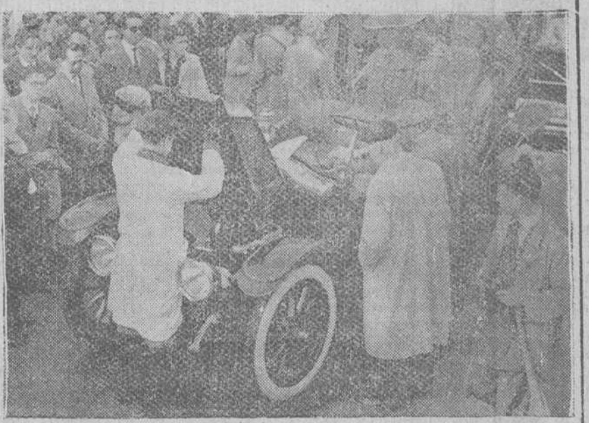
Madrid.—Un momento del desfile de modelos antiguos de automóviles, por las calles de esta capital, que fue presenciado por numeroso público, con motivo de la celebración de las bodas de oro del Real Automóvil Club de España.—(Foto Cifra)

Cleveland (Ohio).—El presidente de la agencia United Press habló en un discurso pronunciado en el City Club, de esta ciudad, de las bases aéreas que ya rodean a Rusia y que van a ser —dijo— reforzadas con las situadas en España, a las que calificó de potente factor para la paz y el orden del Mundo. "Como se está en un estado de paz armada —añadió— esos y otros factores son muy importantes para valorar la perspectiva de conservación de la paz".—Efe