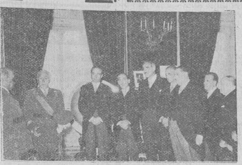
Un momento de la audiencia concedida por S. E. el jefe del Estado a la comisión organizadora de la Asociación Española contra el Cáncer, que acudió a cumplimentarle en el palacio de El Pardo, presidida por el general Alonso Vega.