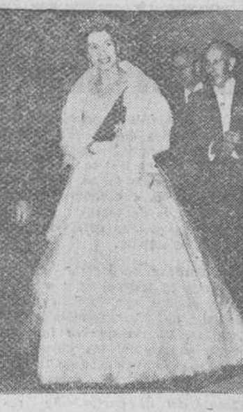
La Soberana británica, Isabel II, fotografiada a su llegada a la fiesta celebrada días pasados en Londres y en la que intervinieron destacados artistas sevillanos. Es este uno de los últimos actos oficiales a los que asistirá la Reina, antes de emprender su largo viaje a aquellos territorios de la Commonwealth.