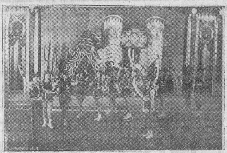
OKLAHOMA: SOBRE UNA PISTA DE HIELO, PERFECTA, SUAVE, UNIFORME, ESTE CUADRO INDIO DE UN MARAVILLOSO TECNICOLOR

Esta clase de espectáculos solamente se han visto hasta ahora en los Grandes Palacios Deportivos de New-York-Viena-Berlín y París