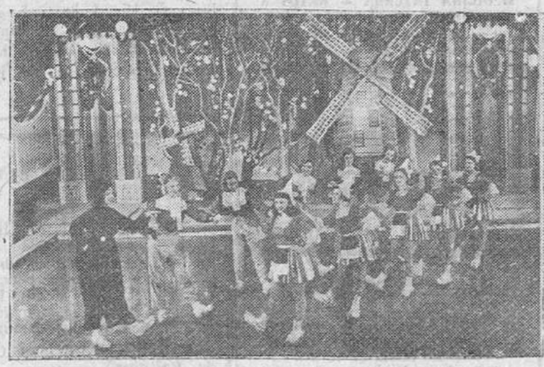
SUEÑOS DE HOLANDA: UNO DE LOS MAS BELLOS Y EMOTIVOS CUADROS DEL "ICE CIRCUS"