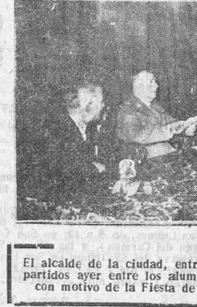
El alcalde de la ciudad, entregando uno de los premios repartidos ayer entre los alumnos de las escuelas nacionales, con motivo de la Fiesta de la Enseñanza.