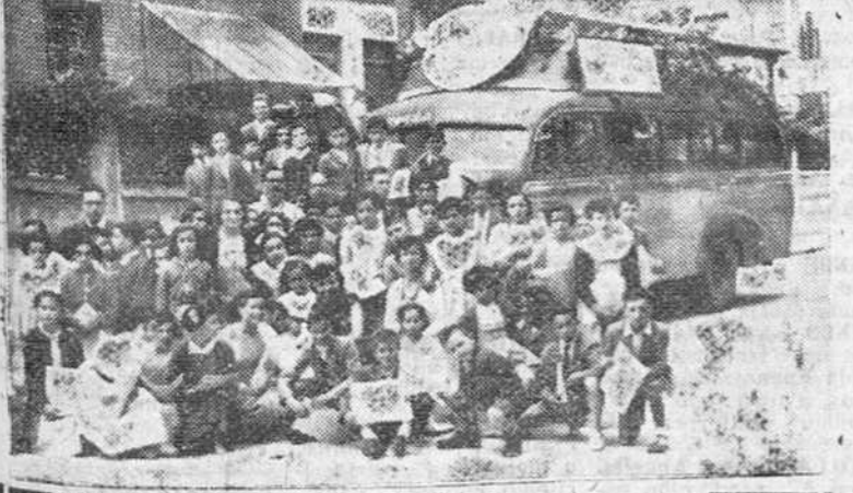
Grupo de niñas y niños pertenecientes a las escuelas de Belorado y su comarca, que el miércoles último efectuaron una visita a Burgos y sus monumentos, en viaje cultural patrocinado por la Caja de Ahorros Municipal.