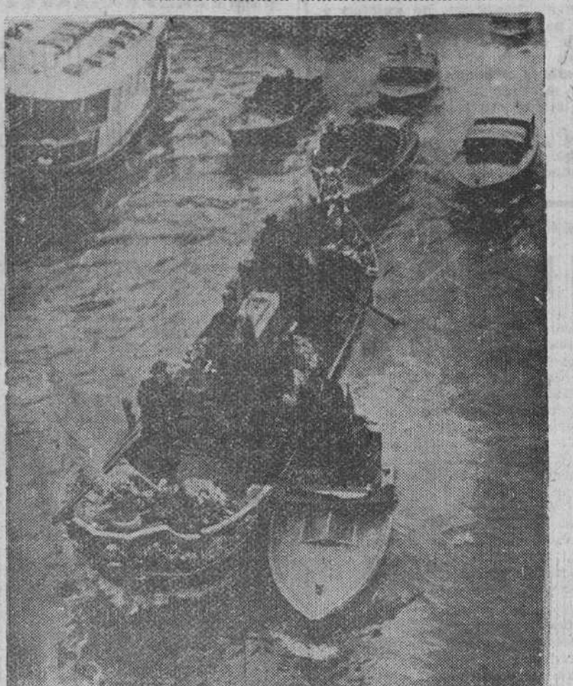
Entierro del Patriarca de Venecia Seguida de ciento veinticinco gondolas con crespones negros la embarcación en ferreo con los restos mortales de monseñor Carlos Agostini, Patriarca de Venecia, se desliza por el Gran Canal, hasta la isla de San Miguel, donde se procedió a la inhumación del Prelado fallecido.