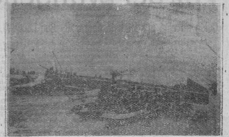
Hellvoetsluis (Holanda). — Obreros especializados en la construcción de los famosos "polders" holandeses, durante la reparación con cemento armado, piedras y sacos de arena de una de las brechas abiertas en un dique cercano a esta localidad durante los pasados temporales.