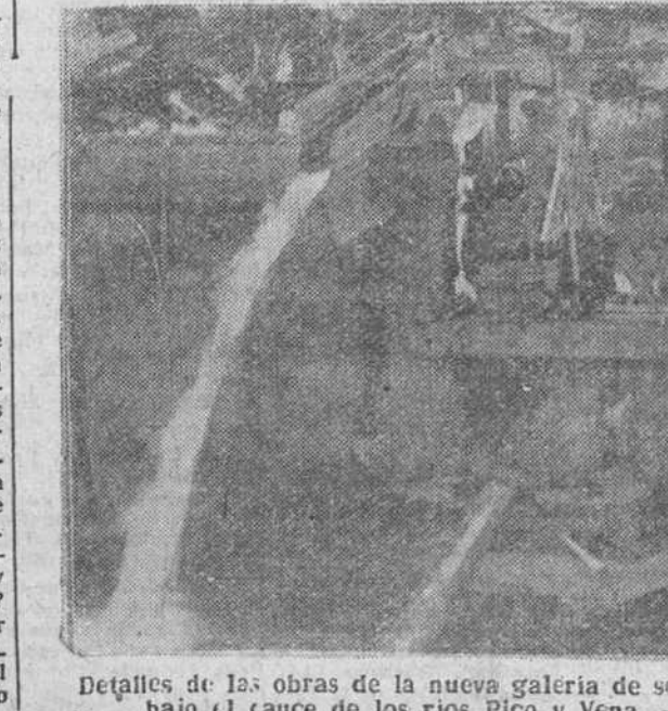
Detalles de las obras de la nueva galería de servicios, construida bajo el cauce de los rios Pico y Vena.