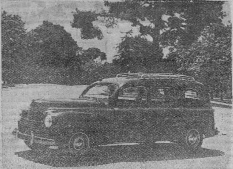
He aquí uno de los coches de cuyo modelo han sido adjudicados cinco para destinarse al servicio público al Excelentísimo Ayuntamiento de Burgos.