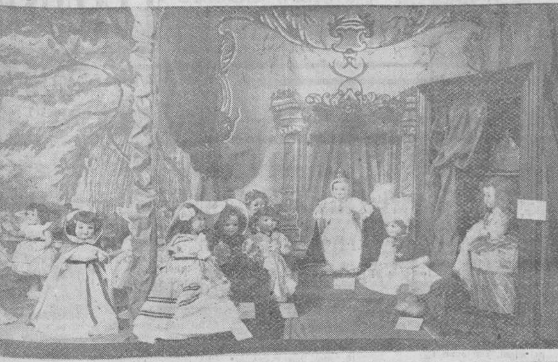
Cautivador rincón de la maravillosa exposición de muñecas presentadas al concurso organizado por la Caja de Ahorros del Circulo Católico de Obreros, con la colaboración de la Asociación de la Prensa de Burgos. El acto inaugural, del que damos cuenta en otro lugar de este número, fue un verdadero acontecimiento el domingo, en la vida de nuestra ciudad.