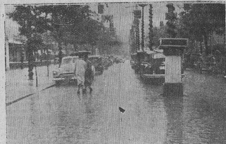
Sevilla.—Descargó el domingo sobre esta ciudad, intenso y continuo aguacero, obligando a aplazar hasta ayer martes el comienzo de la tradicional feria de Abril. En el Real de la Feria, los impermeables y paraguas componen una estampa nortena, sobre el pavimento salpicado por la lluvia.