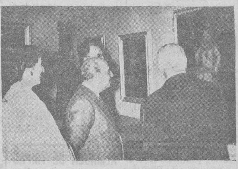
Pontevedra.—Su Excelencia el Jefe del Estado, Generalísimo Franco acompañado de su esposa y de diversas personalidades y autoridades locales, durante la visita efectuada a las distintas dependencias del Museo de Pontevedra.