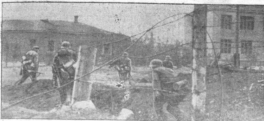
Tropas alemanas de asalto han pasado la alambrada y se dirigen a los próximos edificios donde aún se esconde el enemigo.

Londres.— El vapor soviético "Angarstroi", aclara la radio soviética, fué apresado por un barco de guerra japonés a 130 millas del Japón y obligado a poner rumbo hacia un puerto nipón. Después, de una investigación hecha a bordo, el navio zarpó de nuevo hacia su destino, tomando la ruta señalada por las autoridades japonesas. En la noche del uno de Mayo,