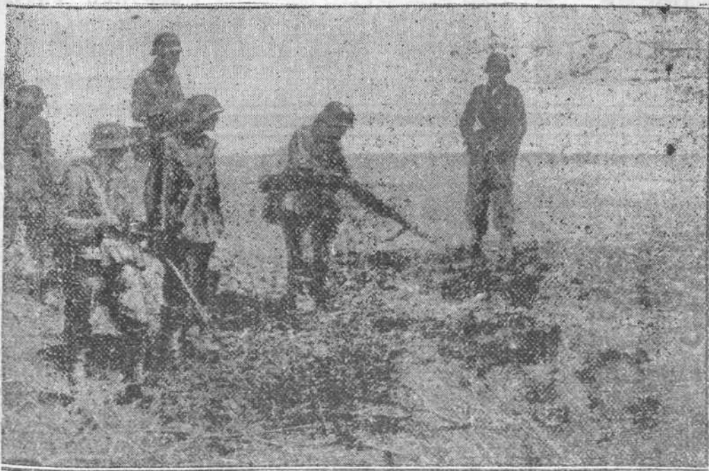
A punta de bayoneta como alimañas, han de ser sacados de su escondrijo los rojos bolcheviques. Estos que se esconden son sobre los que pesan siempre los remedios de asesinatos y atrocidades cometidas. Temen que los soldados alemanes sean como ellos.