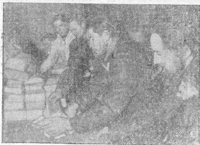
La tripulación de un submarino alemán que ha regresado de nuevo a su punto de partida, recoge con la mayor alegría el correo que durante su ausencia han recibido.