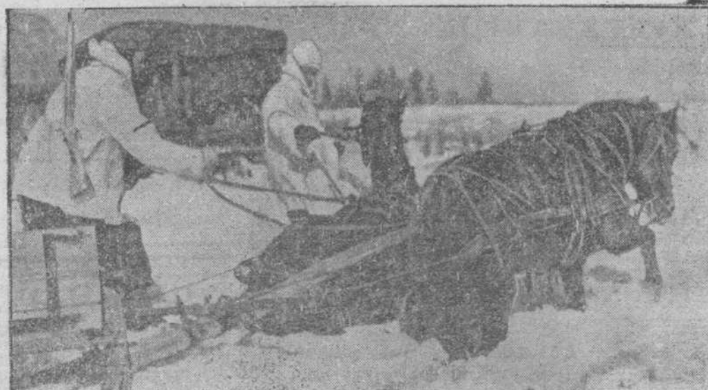
Uno de los caballos que tira de un vehículo alemán se ha caído y arrastra al otro en la caída