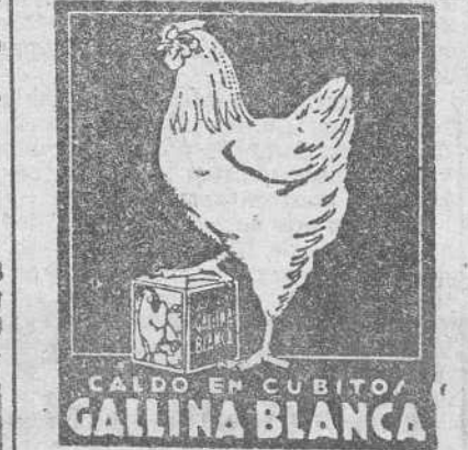
CALDO EN CUBITO GALLINA BLANCA

Informarán: Eladio Peña (Cabañas de Virtus), y Lucinio Díez (Ruijas).