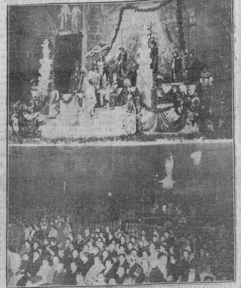
"Fede" captó anoche las precedentes "fotos" de la maravillosa interpretación dada por la Compañía Lope de Vega al Auto Sacramental "La Cena del Rey Baltasar". En plano superior, perspectiva que ofrecía la escena durante dicho acontecimiento artístico. Al pie, aspecto de la Plaza de Santa María, totalmente abarrotada de público. (información en cuarta página)