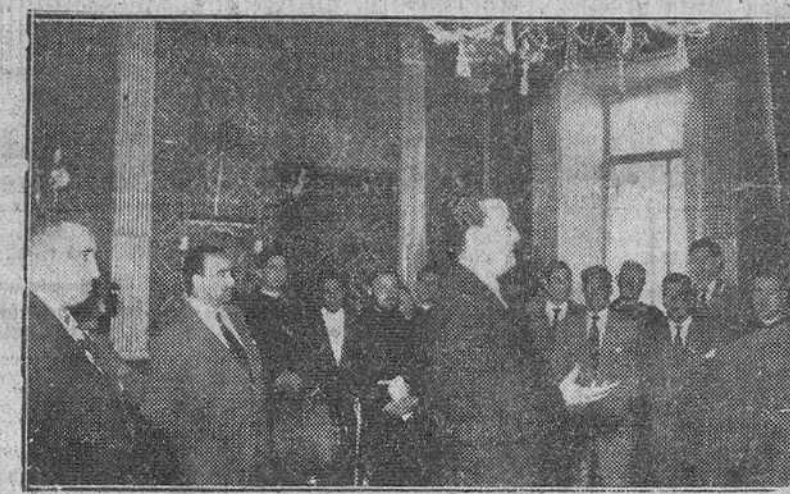
Un momento de la recepción dedicada ayer por el Excmo. Ayuntamiento a los profesores y alumnos del Instituto Histórico - Jurídico "Francisco Suárez".