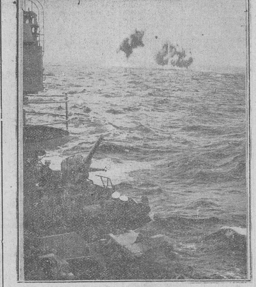
Valencia. — Un aspecto durante las maniobras realizadas por la VI Flota norteamericana y que fueron presenciadas por S. E. el Jefe del Estado, Generalísimo Franco, desde el portaaviones “Coral Sea”.

Ninguna ocasión mejor que la celebración de este Año Mariano que nos recuerda la gloriosa gesta de nuestro pueblo paladín inigualado del dogma de vuestra Concepción Inmaculada.