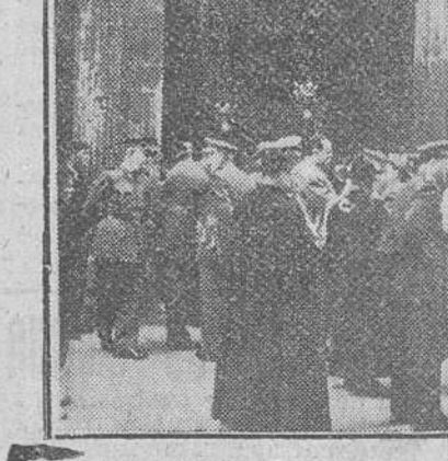
En la iglesia parroquial de San Lorenzo y organizado por las primeras autoridades de la ciudad, se celebró ayer un solemne funeral en sufragio del alma del marqués de San Leonardo de Yagüe, en el segundo aniversario de su fallecimiento. En el grabado, un grupo de concurrentes al piadoso acto, grupo en el que figuran el capitán general de la región, teniente general Alcubilla, gobernador civil, presidente de la Diputación y alcalde de la ciudad, entre otras personalidades.