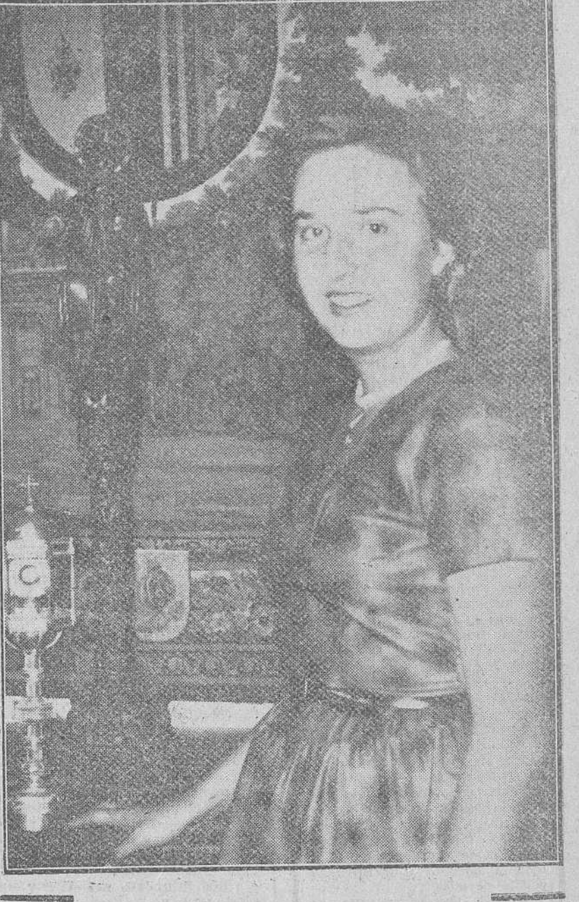
Lioba. — La Infanta doña Pilar de Borbón y Borbón, hija primogénita de los Condes de Barcelona, que ha sido presentada en sociedad en una fiesta celebrada los días 14 y 15 del actual, en la finca "Villa Giralda", de Estoril.