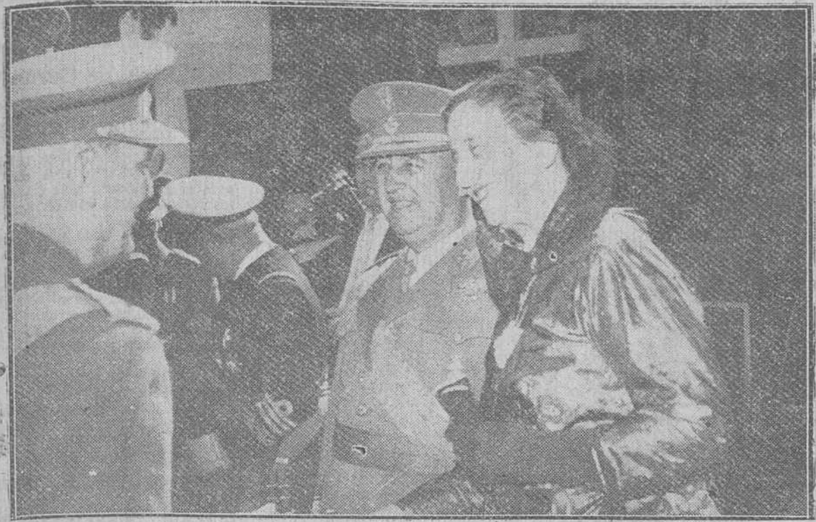
Madrid. — S. E. el Jefe del Estado, acompañado de su esposa, doña Carmen Polo de Franco, recibe la felicitación de uno de los generales del Ejército de Tierra, durante la recepción celebrada en El Pardo, con motivo de la onomástica del Caudillo.