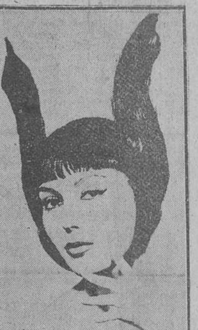
A la línea "H" ha venido a unirse el peinado que el club de belleza "Phyllis" ha estudiado para armonizar con la citada línea. Por ahora sólo lo usarán algunas damas, en fiestas de noche en París.