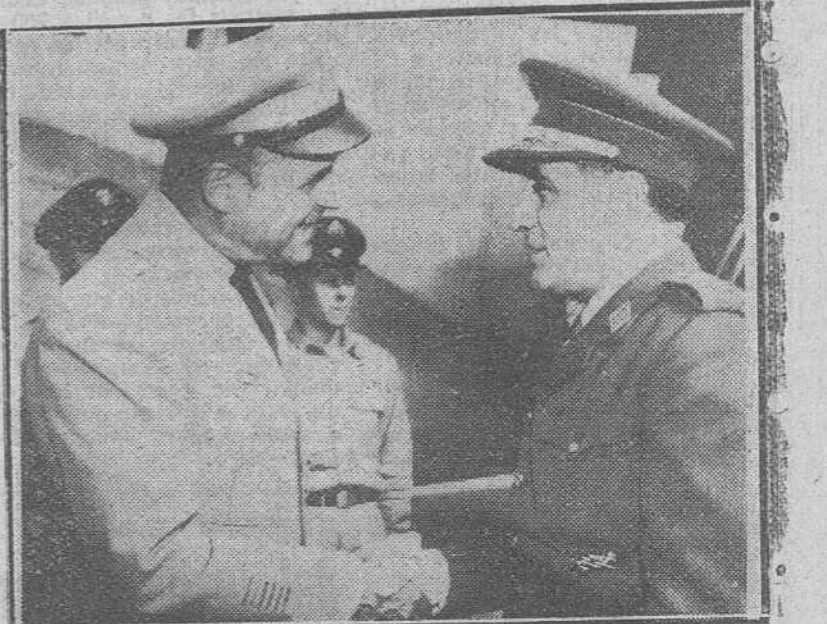
Washington. — A su llegada al aeródromo de Washington, el ministro del Ejército español, teniente general Muñoz Grandes, recibe la bienvenida del jefe del Estado Mayor del Ejército norteamericano, general Matthew B. Ridway.

Conjeturas en torno al próximo viaje de Papagos a nuestra Patria