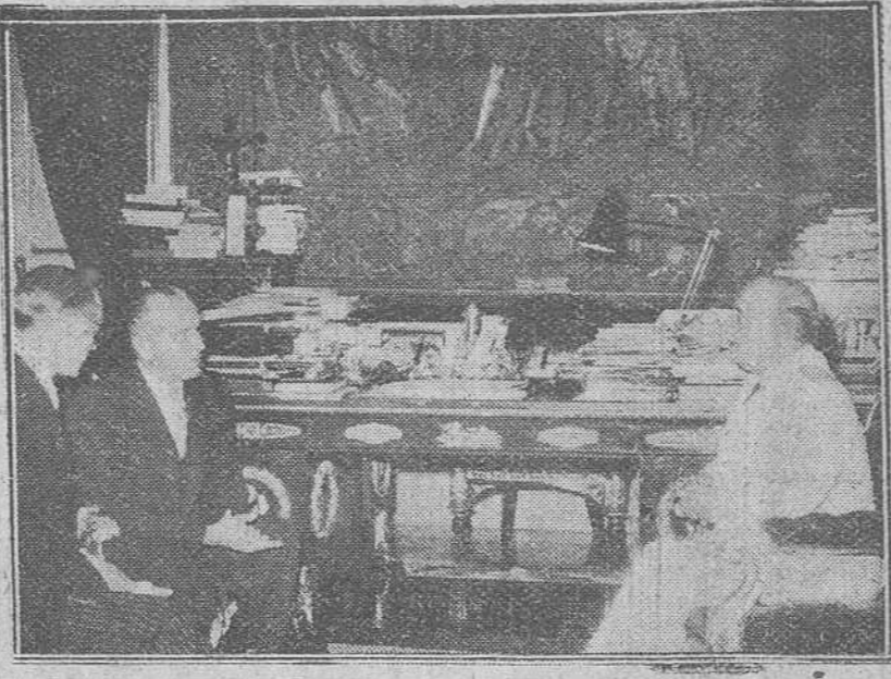
Madrid. — Su Excelencia el Jefe del Estado durante la audiencia concedida al ex-primero ministro del Líbano, S. E. Abdulla El Yafi.