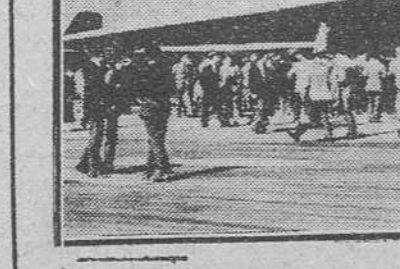
En la exhibición aérea anual que se celebra en Farnborough (Inglaterra), el principal atractivo ha sido el trio de aviones "V" bombarderos atómicos, el "Valiant", el "Vulcan" y el "Victor". En la fotografía vemos a los espectadores rodeando un Avro "Vulcan" de ala delta y cuatro motores a reacción.