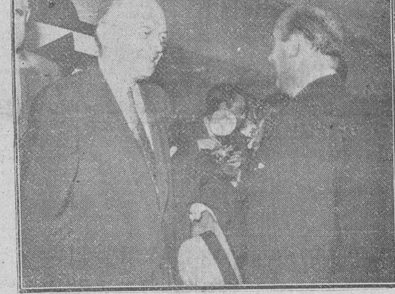
Madrid. — Un momento de la llegada a la capital de España, por el aeropuerto de Barajas, del director de la F. O. A., Mr. Harold Stassen, que fué recibido por el ministro de Comercio, embajador de los Estados Unidos y otras personalidades.