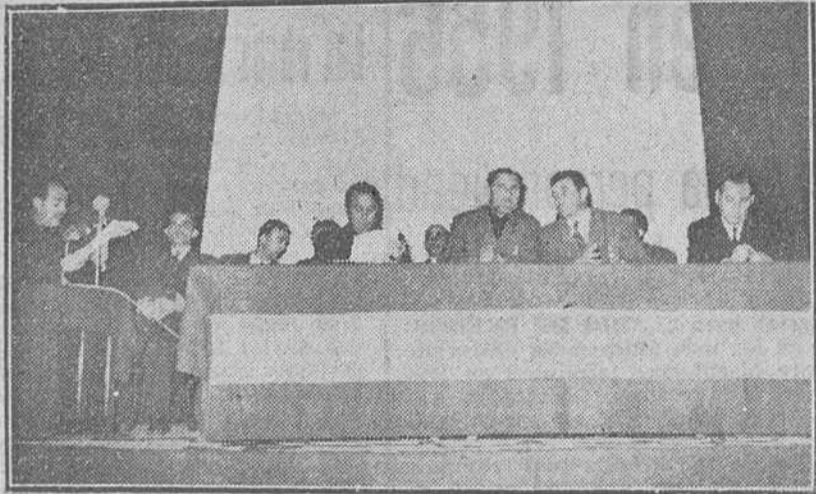
Presidencia de la asamblea plenaria de Hermandades de Labradores y Ganaderos de nuestra provincia, celebrada ayer, con asistencia del gobernador civil y jefe provincial del Movimiento y jerarquías sindicales.

Quedó aprobado un amplio plan de acción para el año próximo y el concierto de la Cámara con la Diputación para la exacción del arbitrio sobre la riqueza agrícola