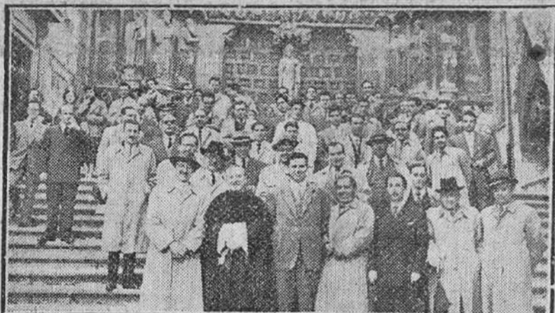
Dos fotos de la actualidad local: Arriba, el gobernador civil señor Posada Cacho durante su intervención en el acto de clausura de la Asamblea interprovincial de transportistas. En el grabado inferior aparecen ferrieras sindicales y agentes de Seguros después de la misa celebrada en la Catedral para solemnizar el "Día del Seguro".