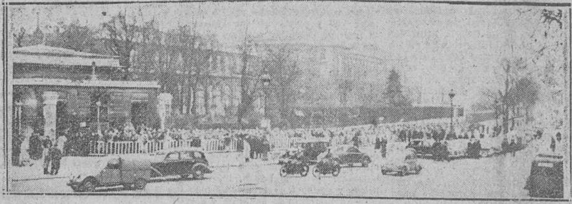
París. — Los alrededores del palacio de la Asamblea Nacional francesa, tuvieron que ser acordonados para contener la gran cantidad de público que esperaba el resultado de la votación para la ratificación de los acuerdos de París sobre el rearme alemán.