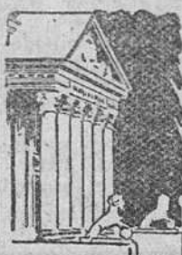
Madrid. (Crónica de "Tachy", para DIARIO DE BURGOS.)

Iturbi viene a España a descansar unos días.- El frío es invernal también en Madrid