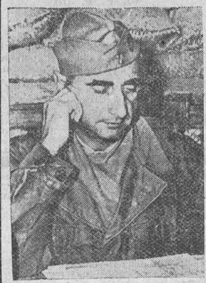
El coronel De Castries, comandante de la sitiada guarnición de Dien Bien Fu, que ha sido ascendido a general en el campo de batalla.—(Foto Gil del Espinar).