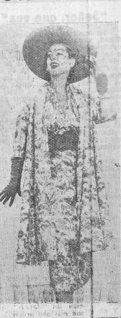
Elegante conjunto de vestido y chaquetón, en vistoso estampado, original de Pierre Balmain y que es una de las más acertadas creaciones, en la nueva silueta de Primavera.