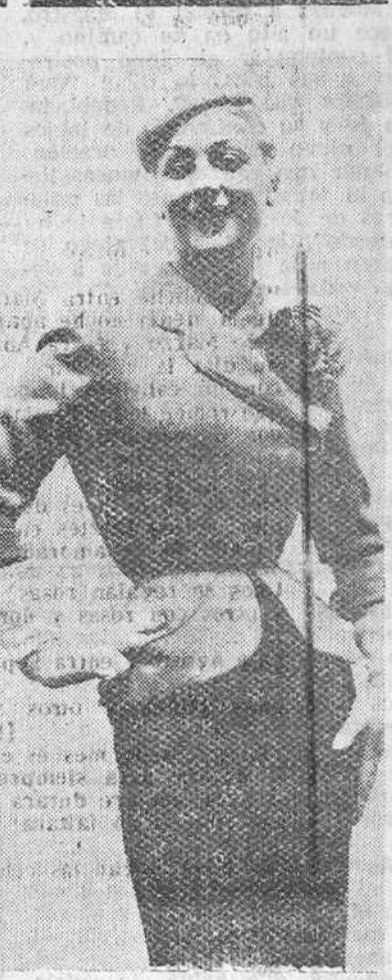
Una creación de Pierre Balmain, presentada entre los nuevos modelos para la Primavera, exhibidos recientemente en París. - (Foto Gil del Espinar).