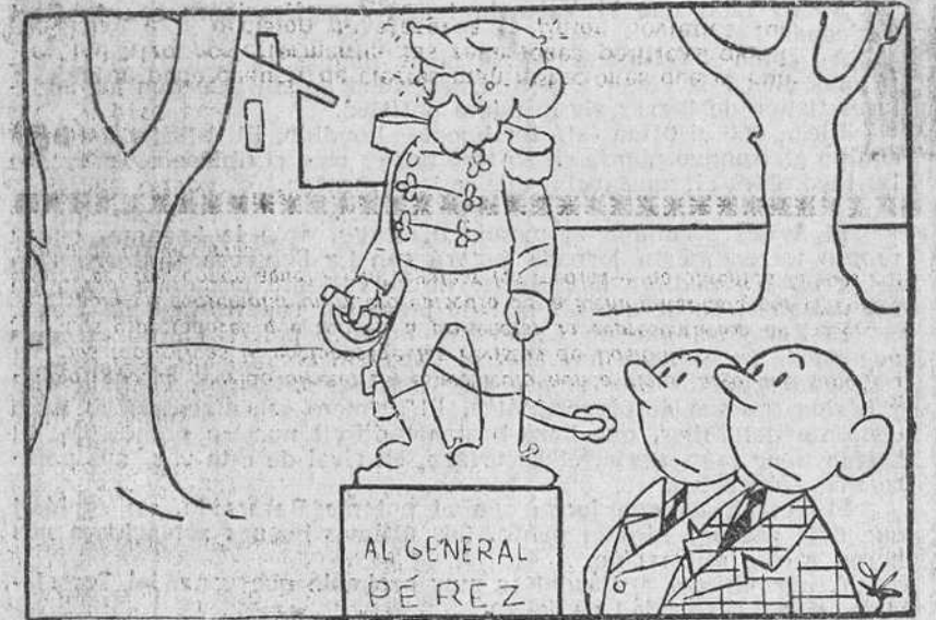
—Esto pasa por haberla hecho de granito.