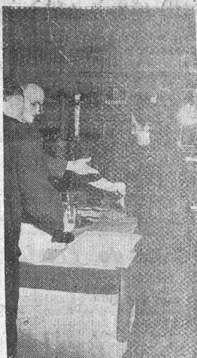
Actos conmemorativos de la Ley fundacional del I. N. de Previsión celebrados en Burgos.