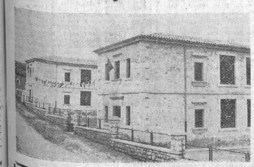
Vista parcial del soberbio grupo escolar, que fue bendecido ayer en Regumiel de la Sierra, por el señor Obispo del Burgo de Osma, e inaugurado solemnemente, con asistencia del Gobernador civil y otras autoridades y jerarquías provinciales.